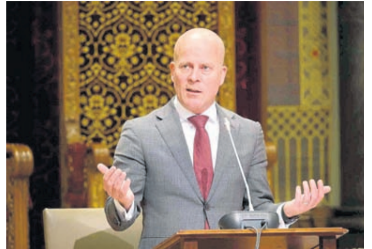
transferi urgentemente – den anticipacion di aprobacion di Tweede Kamer.

E necesidad tambe ta halto na Aruba. Nos pais a cumpli cu tur condicion, y pues e pago di AFL. 181 miyon lo wordo